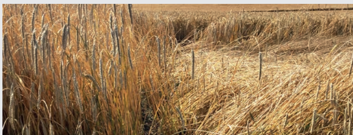
Billede 2: Lejesæd. Heltop til venstre - konkurrent til højre.